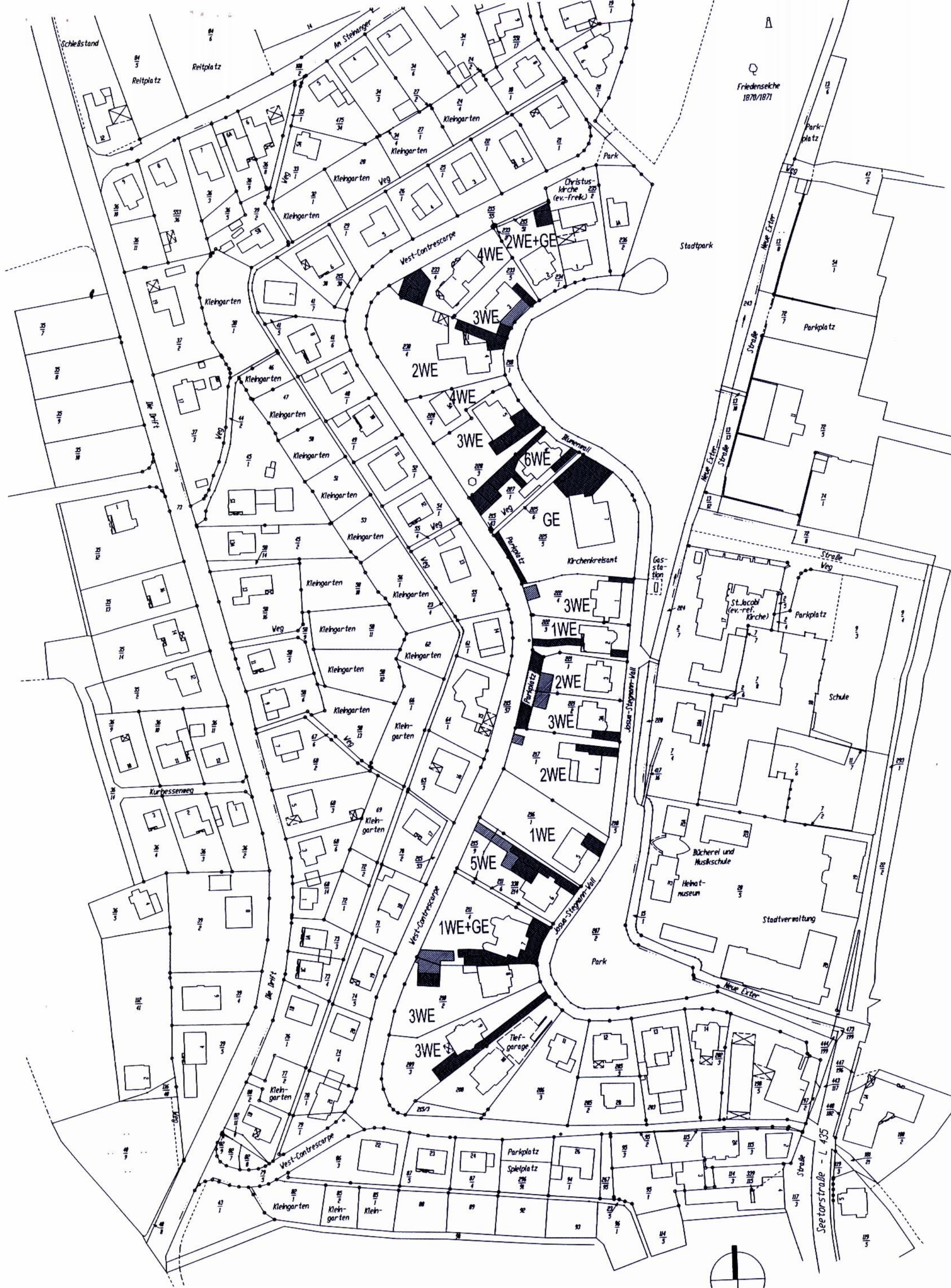
Bebauungsplan Nr.68 "Josua-Stegmann-Wall" Darstellung der zulässigen Einstellplätze und Zufahrten M.1:1500